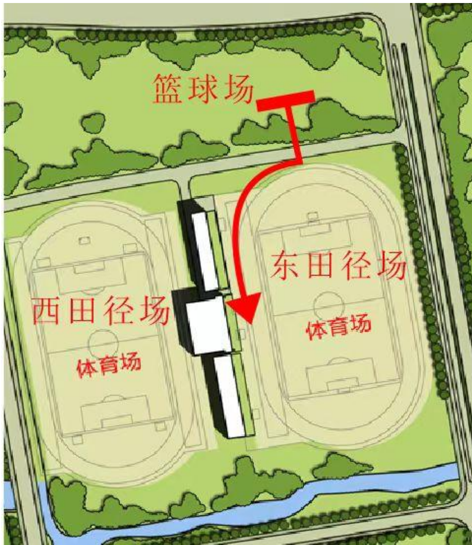
附件 3：各方阵入场前准备位置示意图